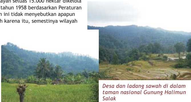
Desa dan ladang sawah di dalam taman nasional Gunung Halimun Salak

Pemerintah Kabupaten Lebak juga memiliki klaim yang berbeda terhadap wilayah ini berdasarkan interpretasi sejarah dan kebijakan yang berbeda pula. Wilayah seluas 15.000 hektar dikelola oleh perusahaan pertambangan sejak tahun 1958 berdasarkan Peraturan Pemerintah No. 91 tahun 1961. Hukum ini tidak menyebutkan apapun mengenai zona hutan negara, dan oleh karena itu, semestinya wilayah tersebut dipertimbangkan sebagai tanah dibawah penguasaan negara, namun tidak sebagai zona hutan negara. Kecuali jika perbedaan interpretasi yang ada dari ketiga klaim dan kebijakan ini diselesaikan dan kebutuhan serta kepentingan semua pihak yang bersangkutan dipenuhi, konflik akan cenderung membahayakan keanekaragaman hayati di wilayah tersebut.