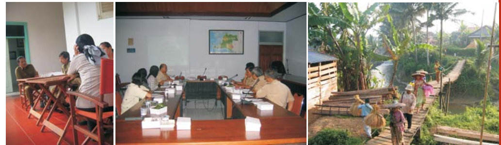
wawancara, dialog dan aktivitas masyarakat selama proses RaTA